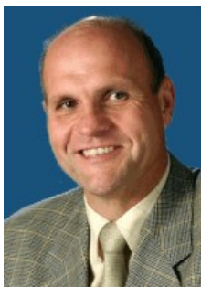
Karl-Wilhelm Röhm MdL