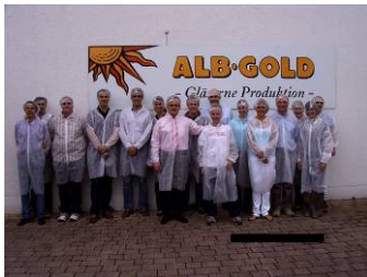
Besichtigung bei Alb-Gold