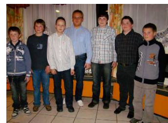
Die neue JU Lichtenstein