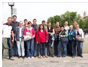
Auf der Regensburger Donaubrücke