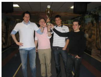
Die Sieger beim Kegeltturnier