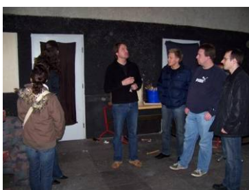
Besuch im Uracher Jugendhaus