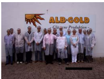
Besichtigung bei Alb-Gold