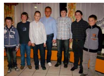
Die neue JU Lichtenstein