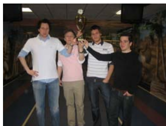
Die Sieger beim Kegelturnier